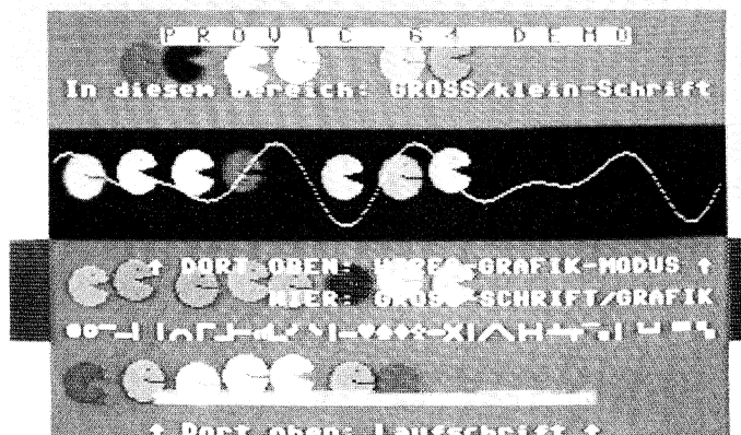
So werden die Fähigkeiten von »Provic 64« demonstriert

Im Grunde ist jeder der vier Pseudo-VICs wie der echte VIC zu behandeln. Ausnahmen sind hier nur die Register 30 (Sprite-Sprite-Kollision) und 31 (Sprite-Hintergrund-Kollision), die sich auf den jeweils vorausgegangenen Bildschirmbereich beziehen. Die Register 19 und 20 (Lightpenkoordinaten), sowie 25 und 26 (IRQ-Flags und -maske) werden nicht behandelt, da diese Funktionen nur direkt über den VIC 6567 sinnvoll gehandhabt werden können. Außerdem hat jeder Pseudo-VIC noch zusätzliche Register für zwei Flags (REG 47 und REG 57), acht Sprite-Pointer (REG 48 bis REG 55),