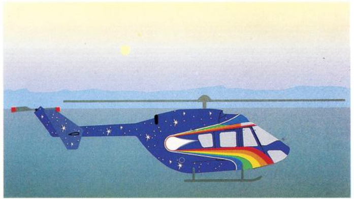
Bild 13. Hubschrauber BK 117 mit 8000 x 8000 Punkten Auflösung

Der vierte und letzte Bereich, wohl der wichtigste überhaupt, ist die Öffentlichkeitsarbeit. Mit Video- und Diavorführungen, Vorträgen, Ausstellungen und Diskussionsrunden wird die Öffentlichkeit auf die Probleme