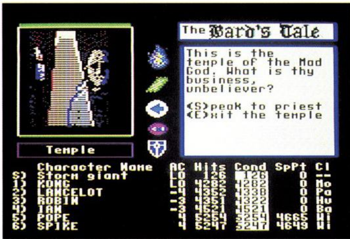
Bild 3. Tempelbesuch bei Bard's Tale

Die sechs geplanten Fortsetzungen (The Dungeon, The Arena, The Palace, The Wilderness, The Revelation und The Destiny) werden es dem Spieler dann erlauben, Untergrund, Paläste und Umgebung von Xebecs Demise zu erforschen, das Rätsel um die Entführung zu lösen und schließlich zur Erde zurückzukehren.