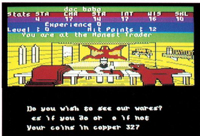
Bild 1. Einkaufsbummel bei Alternate Reality