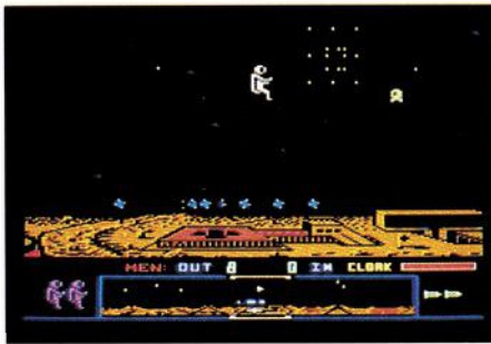
Bild 1. Dropzone

Vor gut einem dreiviertel Jahr kam die Firma Ocean auf eine gute Idee: Sechs ältere Titel, die sich nicht mehr so recht verkaufen, wurden auf eine Diskette gepackt und zum Preis von einem einzelnen Spiel verkauft. In Deutschland übernahm Quelle den Vertrieb dieser ersten »Compilation-Disk«. Der durchschlagende Verkaufserfolg sorgte für Nachzieher. Inzwischen häufen sich die Spielesammlungen auf Diskette oder Kassette. Die beiden unserer Meinung nach besten stellen wir Ihnen genauer vor und weisen auf andere empfehlenswerte hin. Gleich zu Anfang sei noch gesagt, daß wir verständlicherweise auf unsere Bewertungskästen verzichten müssen, da sich die Sammlungen als solche nicht bewerten lassen und wir auch keinen Platz haben, jedem Spiel einen eigenen Kasten zu geben.