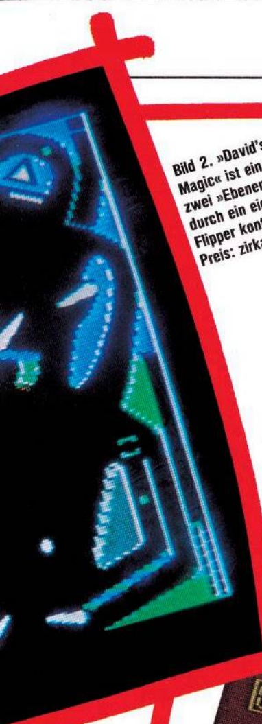
Bild 2. »David's Midnight Magic« ist ein Automat mit zwei »Ebenen«, die jeweils durch ein eigenes Paar Flipper kontrolliert werden. Preis: zirka 129 Mark

ses, der notwendig ist, um gewisse Ziele »anzuschlagen«. Auch der Zufallsgenerator, der in Computersimulationen von Flipperautomaten verwendet werden kann, um zu verhindern, daß die Kugel nach ihrem Abschluß immer auf der gleichen Bahn läuft, darf vom Benutzer programmiert werden. Da es bei manchen Einstellungen passieren kann, daß sich die Flipperkugel an irgendeiner Stelle des Spieltisches »totläuft«, hat man außerdem die Möglichkeit, alle Veränderungen vor dem Abspeichern auf Diskette vom Computer testen zu lassen. Wer überdies die Einstellungen an seinem Flipper vor den neugierigen Blicken anderer schützen will, kann dies mittels einer sechsstelligen Zahlenkombination tun.